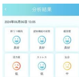
声による分析技術