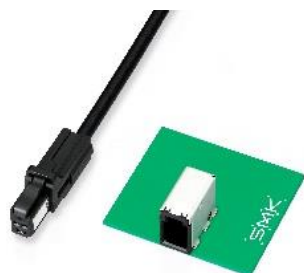
車載 Ethernet 対応コネクタ SE-R1 シリーズ